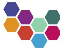
SÓKNARÁÆTLUN NORÐURLANDS EYSTRA